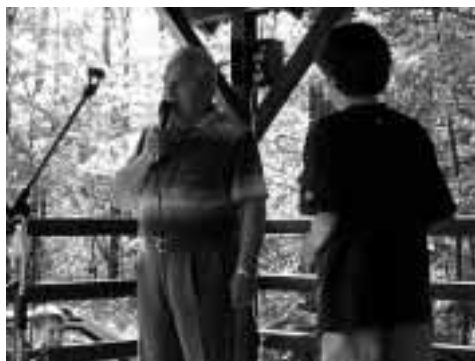
Olympijský vítěz J. Raška.

z Frýdku–Místku, nechyběly soutěže pro děti včetně možnosti projížďky na čtyřkolce. Počasí nám přálo a myslím, že všichni zúčastnění mohou vzpomínat na příjemné odpoledne.