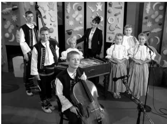
Pohádkové ráno (cimbál. muzička ZUŠ Z. Buriana)