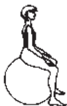
Obr. 4. Správné (přirozené) držení těla v sedu na míči

Pečlivě prostudujte znaky správného i nesprávného sedu a porovnejte následující obrázky (obr. 4-5). Při nácviku správného sedu dodržujte jednotlivé kroky a začínejte vždy od postavení pánve. Teprve po osvojení přirozeného (správného) držení těla v sedu na míči začněte cvičit.