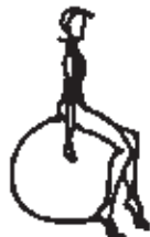
Obr. 1 Nesprávná velikost míče

Pro sed na míči je nesmírně důležitá volba velikosti míče (obr. 1 - 3)