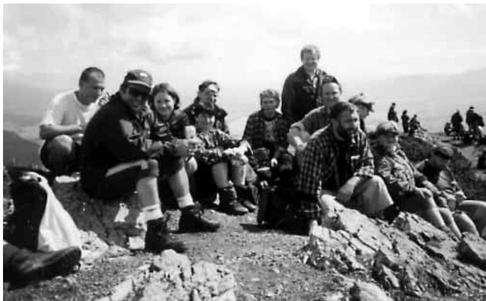
Hukvaldští turisté odpočívají na vrcholu Velkého Choče