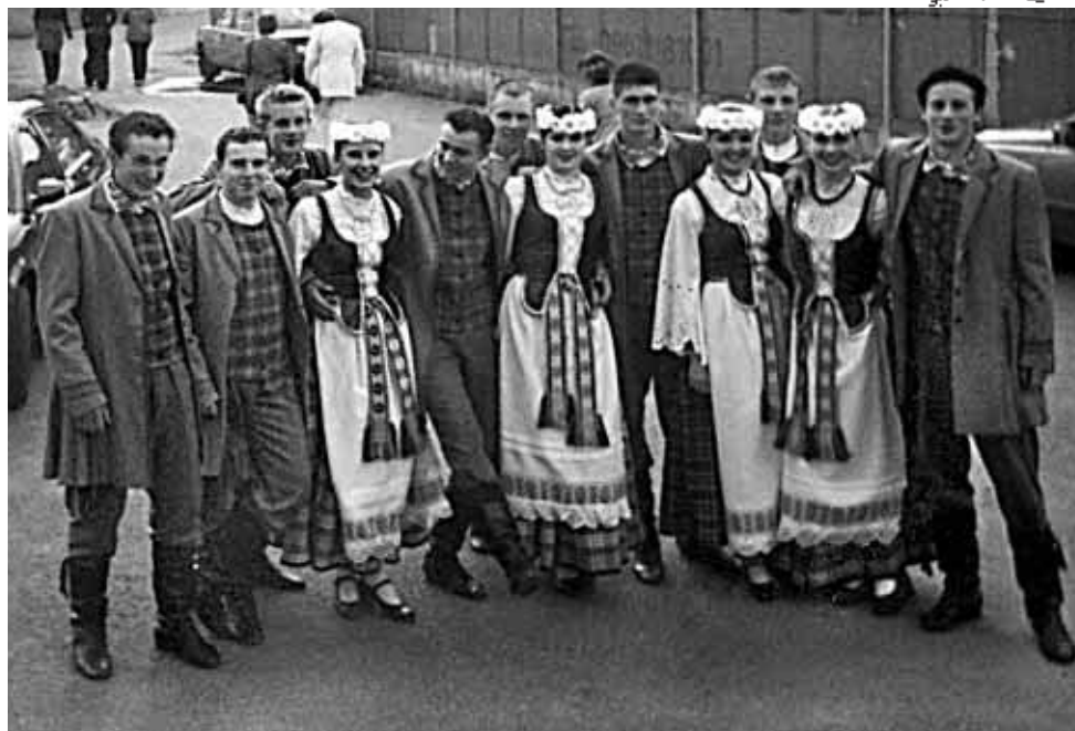
Litevský soubor „Gojus“