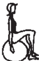
Obr. 2 Nesprávná velikost míče