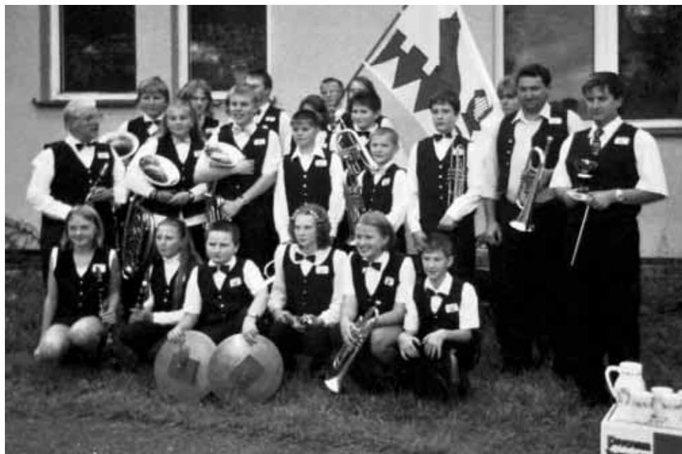
Děti z hukvaldské dechovky