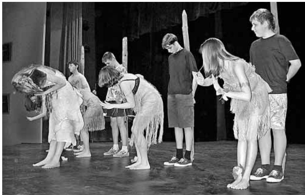
Šamanský tanec „Huta huta“

Všem, kteří se podíleli na přípravě této oslavy patří zasloužené poděkování nás všech přítomných. Přejeme žákům, učitelům i ostatním pracovníkům, aby i nadále dosahovali tak pěkných výsledků