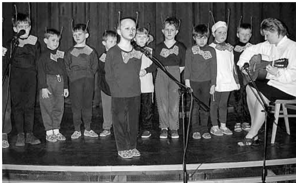
Mravenečkové z 1. ročníku

8. listopadu 2000 tomu bylo 20 let, co byla slavnostně otevřena tato školní budova a zahájena výuka. Už při položení