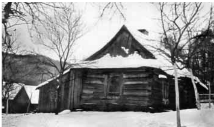
Tenkrát na Podoboří stávala tato „Vendelínova chalupa“.